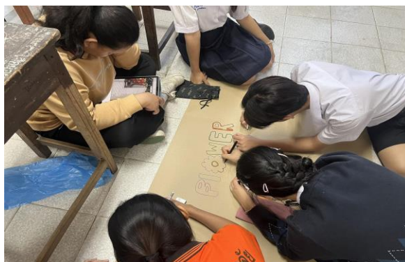
ภาพที่ 1 การจัดการเรียนการสอนการอ่านจับใจความภาษาอังกฤษโดยการเขียนแผนภาพเรื่องราว

จากตารางที่ 1 พบว่าค่าเฉลี่ยผลการเปรียบเทียบผลการเรียนรู้การอ่านจับใจความภาษาอังกฤษหลังเรียนกับเกณฑ์ร้อยละ 80 ของนักเรียนชั้นมัธยมศึกษาปีที่ 5 สรุปได้ว่านักเรียนที่ผ่านเกณฑ์การทดสอบจำนวน 33 คน คิดเป็นร้อยละ 84.61 และจำนวนนักเรียนที่ไม่ผ่านเกณฑ์การทดสอบ 6 คน คิดเป็นร้อยละ 15.38 ซึ่งผลความสามารถด้านการอ่านจับใจความภาษาอังกฤษมีคะแนนเฉลี่ยเท่ากับ 15.20 คิดเป็นร้อยละ 83.85 และมีส่วนเบี่ยงเบนมาตรฐาน 1.76 เมื่อเปรียบเทียบระหว่างเกณฑ์กับคะแนนสอบหลังเรียนของนักเรียน พบว่าผลการพัฒนาการอ่านจับใจความภาษาอังกฤษของนักเรียนสูงกว่าเกณฑ์ที่กำหนดไว้